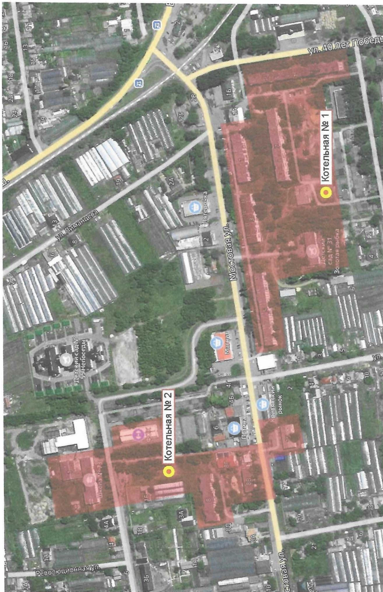
Приложение 1 – Зоны действия источников тепловой энергии