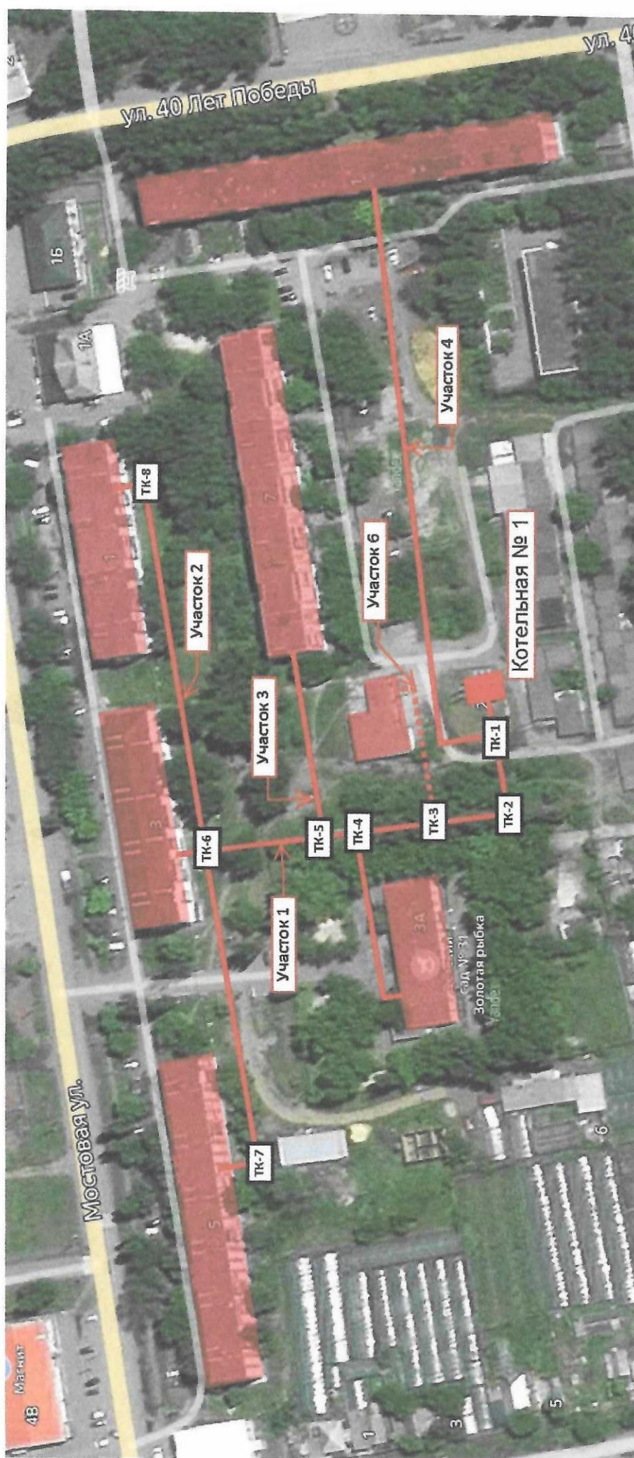
Рис. 1 – Схема тепловых сетей от котельной № 1 ст. Кривянская ул. Октябрьская д. 2Г