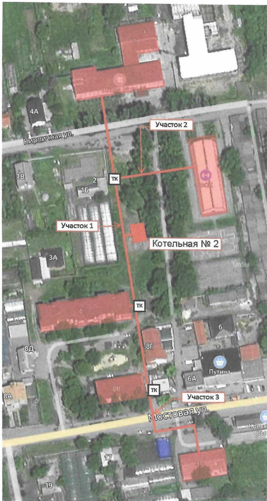
Рис. 2 – Схема тепловых сетей от котельной № 2 ст. Кривянская ул. Кирпичная д. 1Г